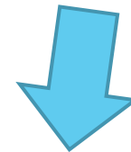
Joseph Hubertus Pilates